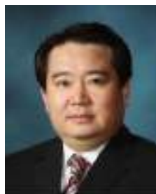
教授 윤찬중(尹贊重) 学历 Bukkyo Univer sity 社会学博士 研究方向 社会福利 学