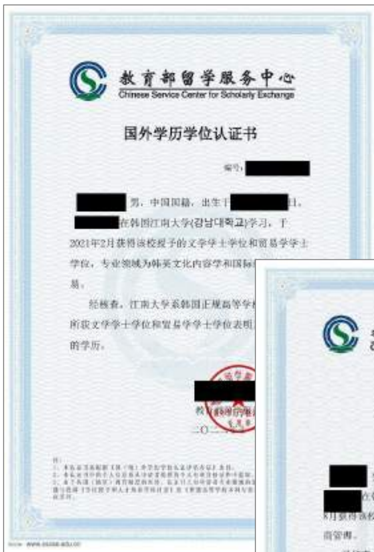
新入学双专业制度学生 学历认证报告书 授课方式: 韩语