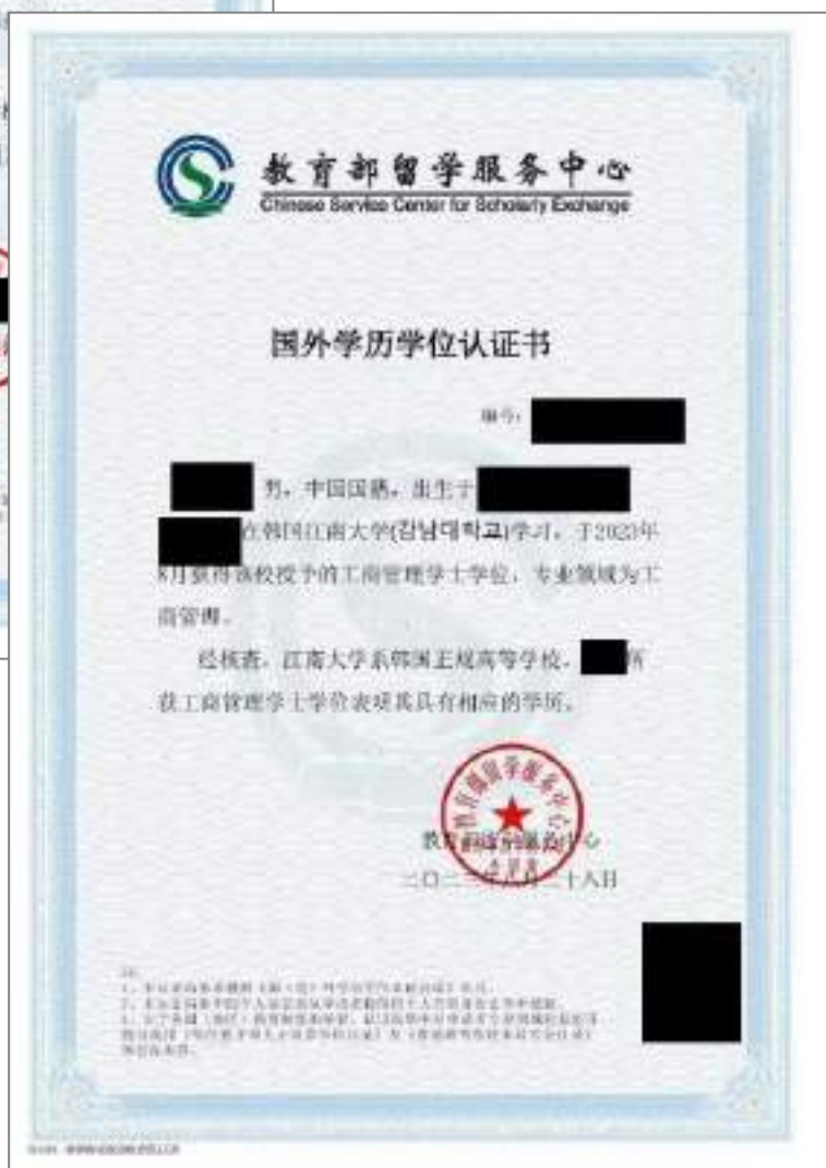
大四插班学历认证报告书 授课方式: 双语授课(中文)